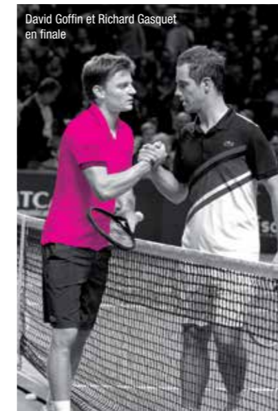
David Goffin et Richard Gasquet en finale

Sportivement, l'Open atteint des sommets avec des matches de grande qualité. En ouvrant son tableau aux joueurs étrangers (David Goffin et Pablo Andujar), le pari est réussi. 13000 spectateurs garnissent les gradins du zénith, le nombre de partenaires connaît encore une progression : plus de 70. Près de 170 bénévoles composent l'équipe et David Goffin inscrit son nom au palmarès au terme d'une très belle finale contre Richard Gasquet. Première diffusion télévisuelle à l'échelle nationale. Dans la continuité de l'édition précédente, l'édition 2014 de l'Open de tennis de Caen a changé de directeur mais pas sa dynamique ! Encore une fois, l'Open de tennis de Caen a proposé un très beau plateau avec la présence de Richard Gasquet, Roberto Bautista Agut, David Goffin, Pablo Andujar et notre parrain Paul-Henri Mathieu. 3 joueurs du TOP 30 mondial et 1 du TOP 40 à Caen ! On retiendra la demi-finale entre l'espagnol Roberto Bautista Agut, alors 15 ème et Paul-Henri Mathieu. Victoire en 3 sets du parrain du tournoi. Peut-être le plus beau match de l'Open. Enchaînement de coups gagnants sous les acclamations d'un public conquis. Formidable moment. Le public a encore une fois répondu présent avec la présence de 12000 spectateurs venus voir ces immenses talents au Zénith. Environ 150 bénévoles ont soutenu l'événement et ont contribué à sa réussite.