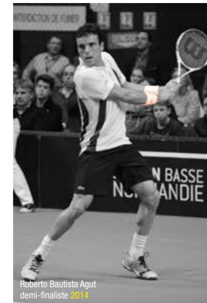
Roberto Bautista Agut demi-finaliste 2014