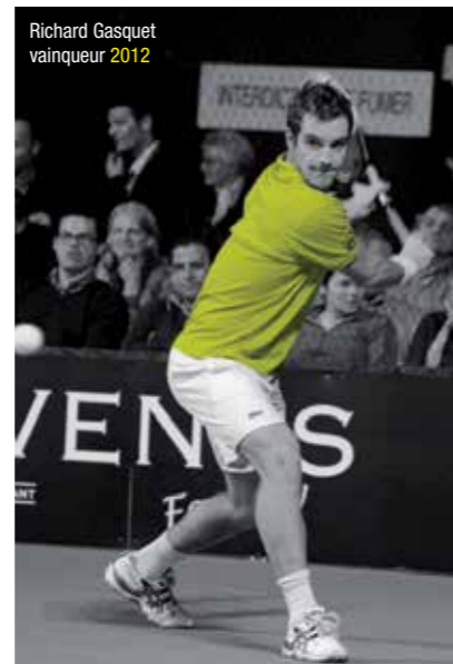
Richard Gasquet vainqueur 2012