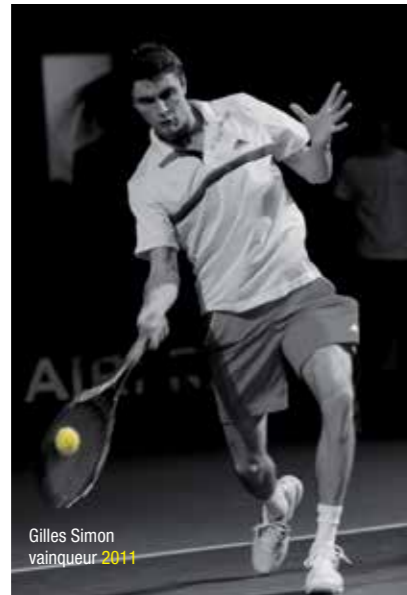
Gilles Simon vainqueur 2011

En 2012, 3 des 4 médaillés français aux Jeux Olympiques de Londres foulent le terrain caennais : Julien Benneteau, Michaël Llodra et Richard Gasquet.