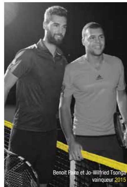
Benoit Paire et Jo-Wilfried Tsonga vainqueur 2015