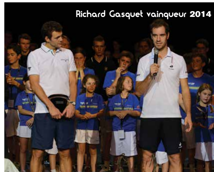
Richard Gasquet vainqueur 2014

Richard Gasquet soulève le trophée pour la deuxième fois en battant le parrain de l'Open Paul-Henri Mathieu en finale (4/6 7/5 6/2).