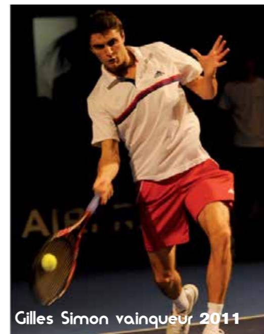
Gilles Simon vainqueur 2011

En 2012, 3 des 4 médaillés français aux Jeux Olympique de Londres foulent le terrain caennais : Julien Benneteau, Michaël Llodra et Richard Gasquet.