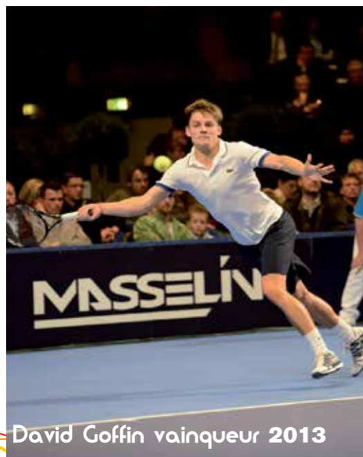
David Goffin vainqueur 2013