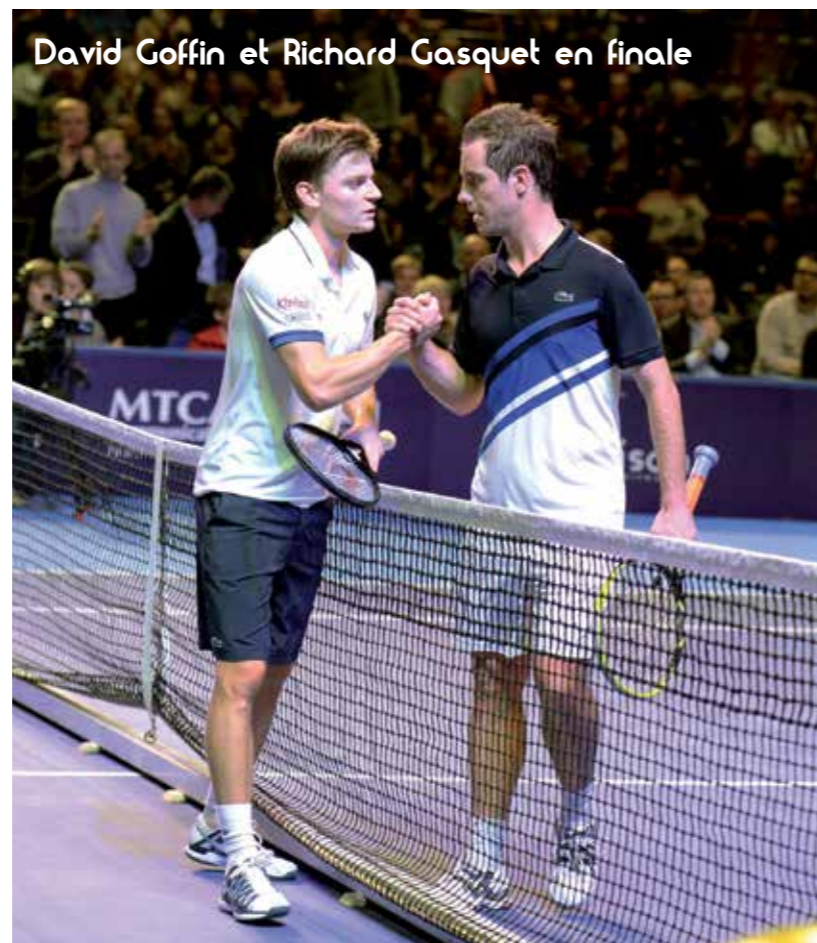
David Goffin et Richard Gasquet en finale

Près de 170 bénévoles rejoignent l'équipe et David Goffin inscrit son nom au palmarés au terme d'une très belle finale contre Richard Gasquet.