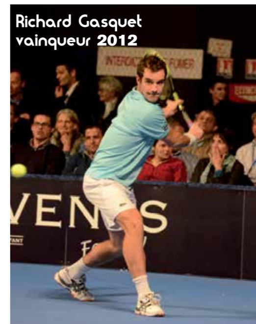
Richard Gasquet vainqueur 2012