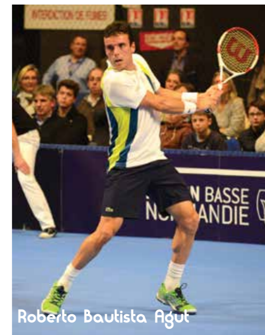
Roberto Bautista Agut